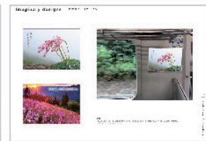
▲ 中山 つばさ (小山城南高等学校出身)